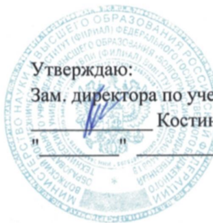
График ОргСРС по кафедре "ВИТ" на 2 семестр 2023 - 2024 учебного года