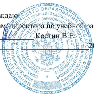
График ОргСРС по кафедре "ВПЭ" на 2 семестр 2022 - 2023 учебного года