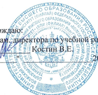
График ОргСРС по кафедре " ВТО " на 2 семестр 2022 - 2023 учебного года