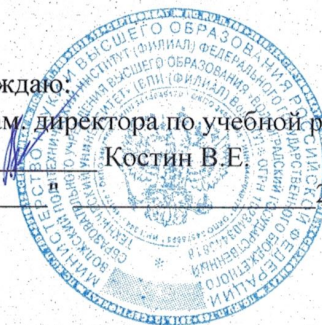
График ОргСРС по кафедре "Информатика и технология программирования" на 2 семестр 2022 - 2023 учебного года