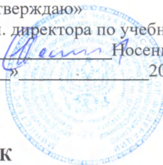
ГРАФИК заседания Государственных экзаменационных комиссий