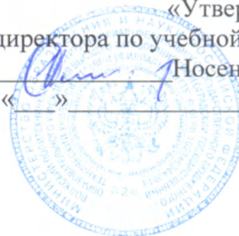
ГРАФИК заседания Государственных экзаменационных комиссий